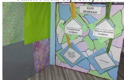
Gambar 3 Kuis Media Caps Scrapbook

Caps Scrapbook sebagai media pembelajaran visual dapat digunakan dalam proses belajar mengajar. Media ini menggambarkan informasi, konsep, dan pesan kepada peserta didik melalui gambar, foto, ilustrasi, sketsa, grafik, tabel, dan kombinasi dari berbagai bentuk visual lainnya. Representasi ini mencakup aspek realistik, simbolis, dan artistik dari suatu