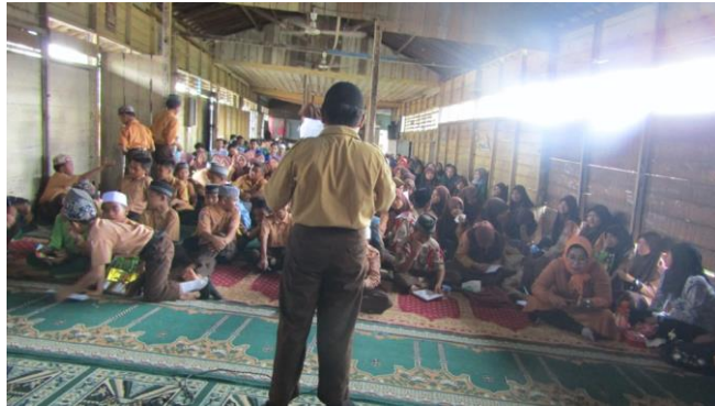
Gambar 3. Penjurian Kompetisi Bahasa Saat Final