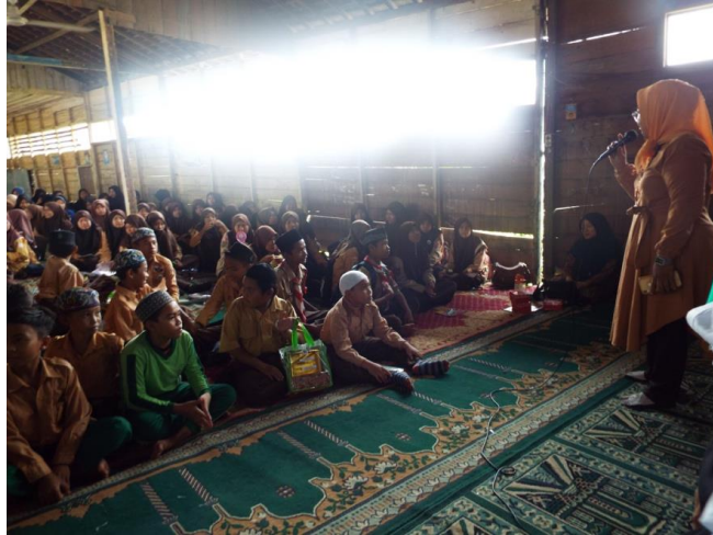
Gambar 2. Menunjukkan Antusiasme Siswa MTs Saat Final